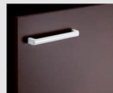
□ VR1 ブラック