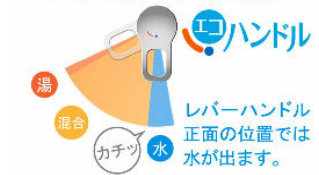
レバーハンドル正面の位置では水が出ます。お湯が混合する位置はクリックでお知らせします。