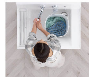
つけ置き洗い中も、バケツを避けての手洗いもOK