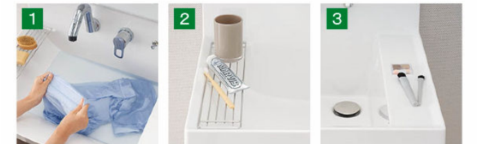
バケツの水汲みや衣類のつけ置き洗いもしやすいです。 コップや泡立てネットなど、濡らしたくないものを、一つ置き洗いもしやすいです。濡れものを気兼ねなく置けます。 置きやすさを便利にします。