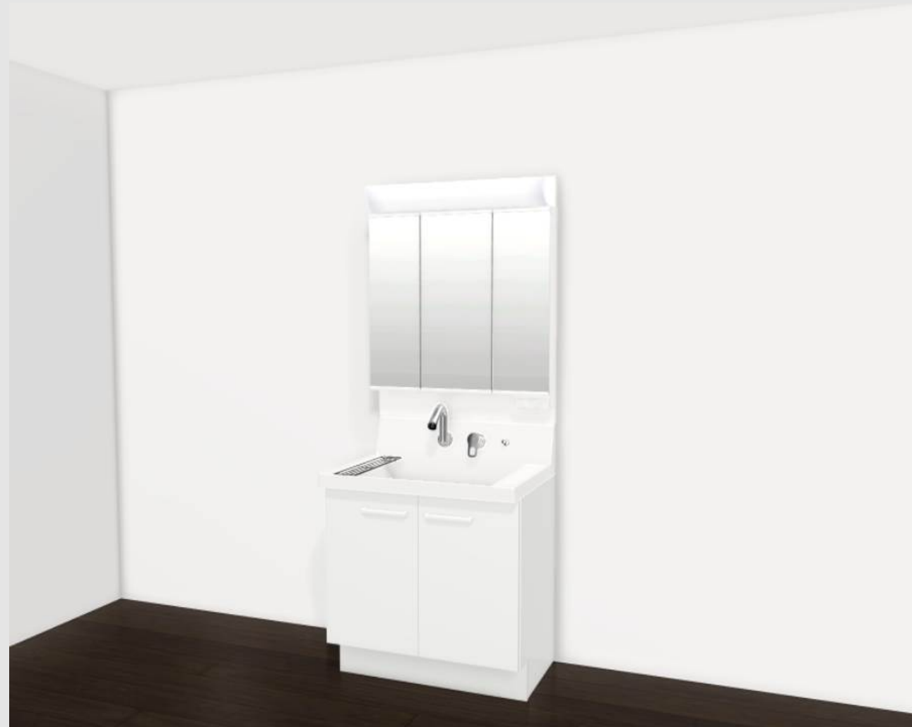
CG合成によるイメージ画像です。