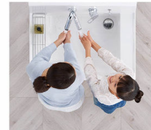
2人並んでの身支度もスムーズ