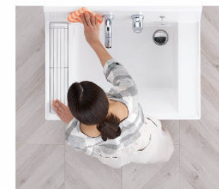
汚れにくくお掃除もカンタン